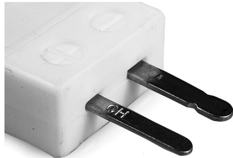
Miniature Hi-Temp Ceramic in-line Plug - HTC (dimensions in mm)

Labfacility are the UK's leading manufacturer of Temperature Sensors, Thermocouple Connectors and associated Temperature Instrumentation and stockings of Thermocouple Cables. The Company has been trading since 1971 and is ISO9001 accredited.